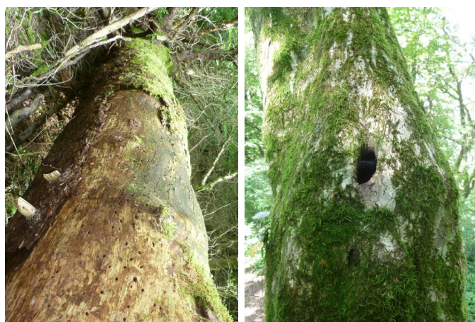
A gauche : un tronc mort sur pied héberge des espèces saproxyliques A droite : un bois sénescant, de diamètre important, présente une cavité, micro-habitat potentiel pour certaines espèces d'oiseaux ou de chauve-souris

Laisser vieillir les arbres, c'est aussi multiplier le nombre de « micro-habitats » disponibles pour certaines espèces. En effet, ces petits éléments du milieu naturels sont exploités par quelques espèces seulement, qui en sont très dépendantes. Maintenir les arbres fendus permet aux chauves-souris forestières de retrouver leur lieu d'hibernation de prédilection plutôt qu'un milieu de remplacement potentiellement moins favorable.