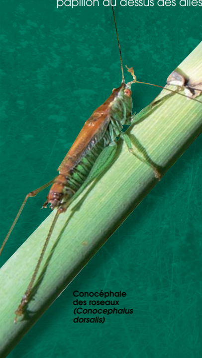
Conocéphale des roseaux ( Conocephalus dorsalis )

Sur le pourtour du bas-marais, encore humide mais enrichi en éléments nutritifs, se développe également une ceinture de hautes herbes ou mégaphorbiaie. L'ensemble constitue une zone refuge pour de nombreuses espèces d'animaux ou de plantes, souvent peu communes. On y rencontre notamment certains insectes protégés, comme une petite « libellule », l'agrion de Mercure ( Caenagrion mercuriale ) et le cuivré des marais ( Lycaena dispar ), papillon au dessus des ailes d'un orange éclatant.