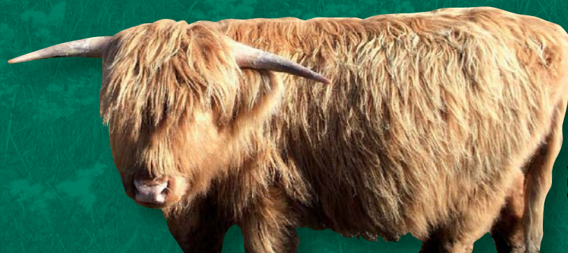
Vache Highland Cattle

Ces animaux permettent, outre la préservation de races anciennes, de maintenir le milieu naturel ouvert et lutter ainsi contre l'abandon des parcelles les moins rentables pour l'exploitant. Toutefois, des opérations de débroussaillage manuel sont régulièrement organisées afin de limiter les pousses des aulnes.