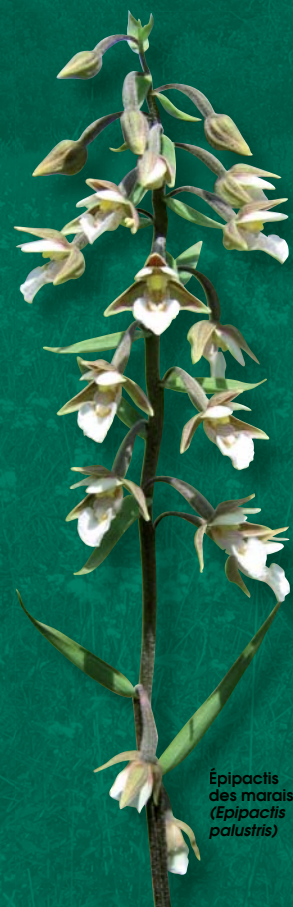
Épipactis des marais ( Epipactis palustris )

maison de l'environnement de Franche-Comté 7 rue voirin 25000 Besançon Tél. 03 81 53 04 20 • cren-fc@wanadoo.fr www.maison-environnement-franche-comte.fr