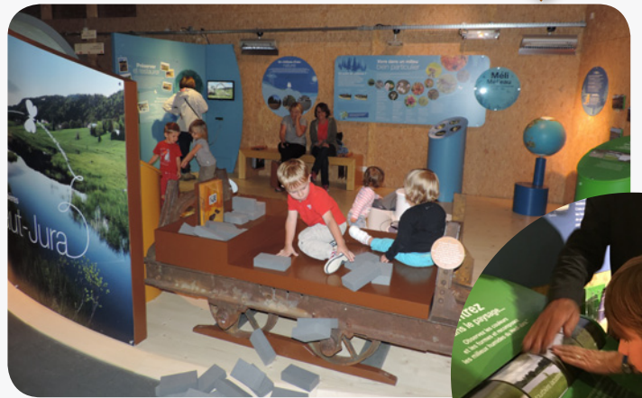
Puzzles, jeux de rouleaux, maquettes, globe terrestre, contes... aideront petits et grands à pénétrer le monde extraordinaire des tourbières.