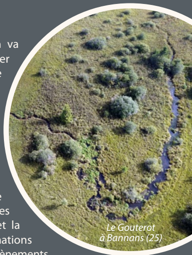
Le Gouterot à Bannans (25)

Comme dans le précédent programme, les études préalables, les travaux de réhabilitation fonctionnelle et les suivis feront également l'objet de moments privilégiés de partages d'expérience et de résultats (colloques et séminaires thématiques). La communication et la sensibilisation (visites de sites, animations pour le grand public et les scolaires, événements, etc.) constitueront également des actions phares. D'ores et déjà, le montage d'un programme de formation destiné à trois lycées agricoles du territoire du massif, en lien avec le carbone des sols tourbeux, est déjà engagé (voir page 5).