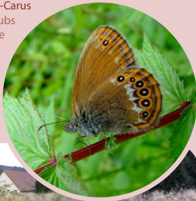
Mélibée ( Coenonympha hero )