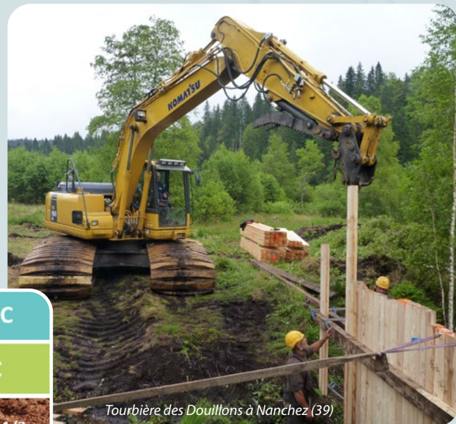
Tourbière des Douillons à Nanchez (39)

L'enjeu auquel nous sommes aujourd'hui confrontés est de conserver les stocks de carbone des tourbières. La réhabilitation de leur fonctionnement naturel demeure probablement le meilleur moyen d'action pour atteindre cet objectif.