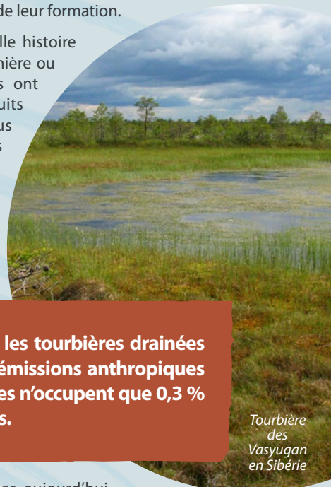
Tourbière des Vasyugan en Sibérie

Malheureusement, cette belle histoire a pris fin lorsque, d'une manière ou d'une autre, les tourbières ont été asséchées. Finis les puits de carbone, les processus s'inversent et nos tourbières deviennent des bombes à retardement pour le climat en relarguant dans l'atmosphère tout ou partie du carbone accumulé depuis des siècles.