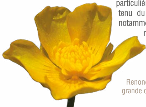
Renoncule grande douve

Concernant les peupliers, des travaux d'abattage et d'évacuation des arbres coupés ont débuté en novembre 2019. Des précautions particulières ont été prises compte tenu du contexte humide du site, notamment pour préserver la reconcile grande douve ainsi que les sols en évitant autant que possible la création d'ornières.