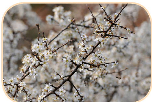
Prunus spinosa

Inutile de dire que cette espèce est problématique quand on cherche à préserver une pelouse ouverte parsemée de petits buissons. Car ce serait également une ineptie de l'éliminer, elle fait partie de ces pelouses si remarquables, elle permet aux pie-grièches d'empaler leurs proies, elle est la plante nourricière d'un papillon protégé (la laineuse du prunellier)... Tout est question d'équilibre.