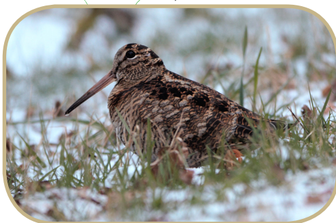
Scolopax rusticola

Oiseau forestier, la bécasse des bois exploite les prairies environnantes pour y trouver sa nourriture. Grand amateur de lombrics, il consomme également de petits insectes, des araignées et des mollusques. Durant le printemps, au moment de la croule (vol nuptial), quel spectacle que de le voir survoler une pâture et l'entendre émettre ce « ouort-ouort-ouort » à la fois grognant et sourd, terminé par un « pissp ! » explosif et perçant.