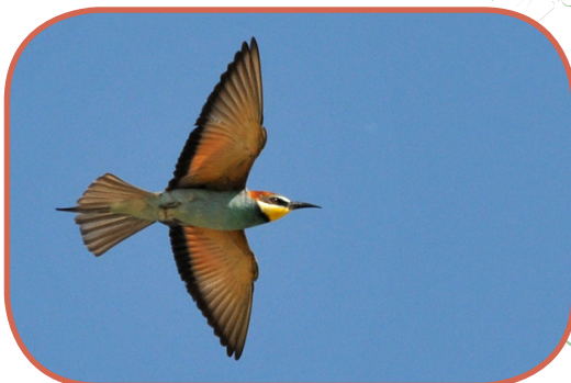
Megrops alpestris

La fin des vacances d'été est proche, les oiseaux migrateurs sont déjà en route pour le Sud. Ce 30 août, des cris roulés caractéristiques retentissent haut dans le ciel. Une quarantaine de guêpiers d'Europe survolent le ravin à la recherche des précieux insectes qui leur permettront d'emmagasiner la graisse nécessaire pour rejoindre l'Afrique de l'Ouest. Nul besoin de s'alourdir avec un quelconque cartable, les dangers seront déjà suffisamment grands (météo défavorable, prédateurs, etc.) pour espérer revenir nicher en Europe l'année prochaine. Alors, bonne rentrée à tous ces fabuleux migrants !