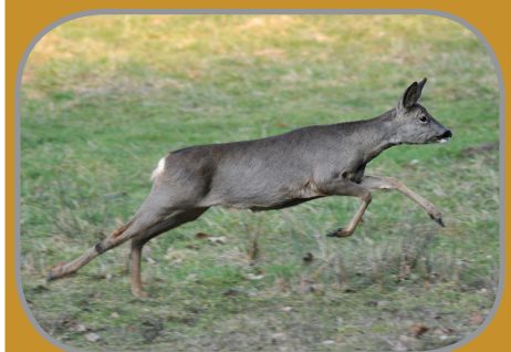
Le chevreuil, gibier victime des « vilains » ?