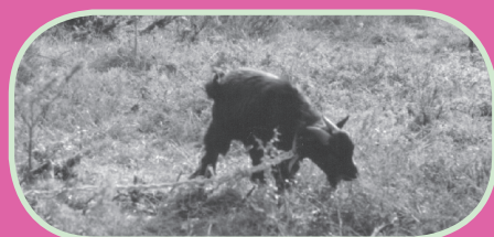
Un des 5 boucs nains avec sa longe