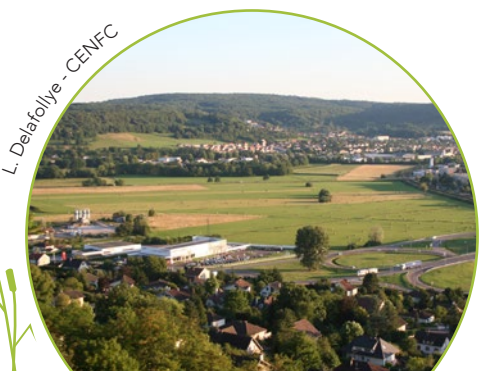
L. Delafolloye - CENFC